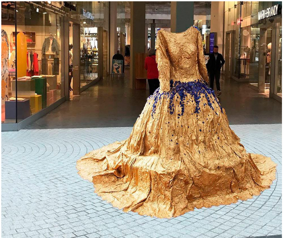
Klänningen var klar redan i våras och har sedan dess stått gömd i en lada i Mangskog.

Själva transporten till Norge var besvärlig eftersom klänningen är över två meter bred och två och en halv meter lång.